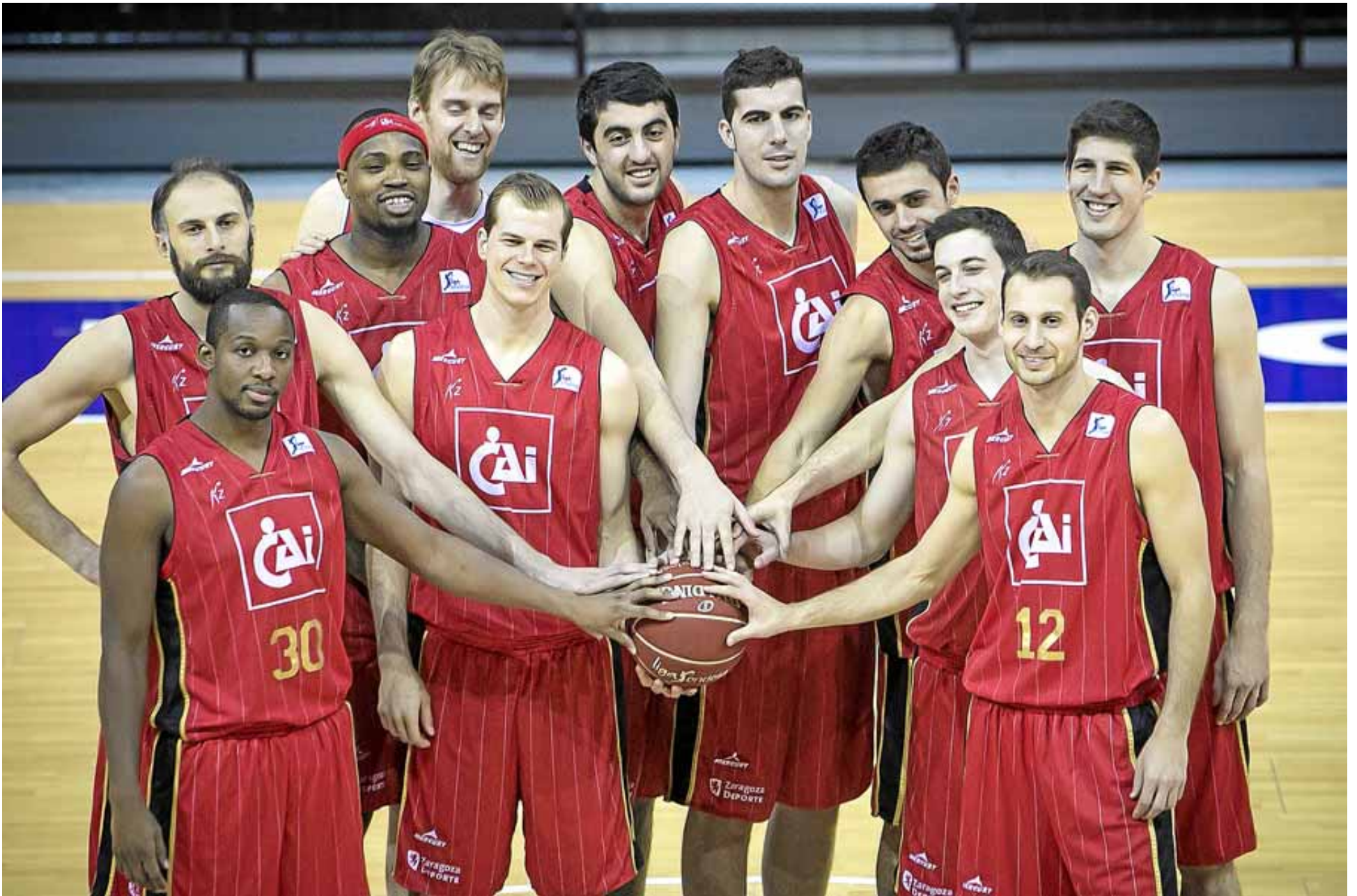
La plantilla del CAI Zaragoza, convencida de sus propias posibilidades, se conjura para la Copa del Rey.