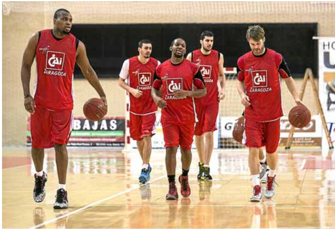
Los jugadores del CAI Zaragoza se entrenaron ayer en el pabellón Siglo XXI.

El CAI, además, actuará al abrigo de sus propios aficionados. El partido se desarrollará en Huesca, ya que el espectáculo 'Disney on Ice', que se celebra en Zaragoza hasta el jueves, lleva instalado desde ayer en el pabellón Príncipe Felipe. Pese al cambio de escenario, el equipo no estará solo en la localidad oscense. En el Palacio de los Deportes, con una afora cercano a los 5.000 espectadores, se reunirán cerca de 3.000 seguidores. No será lo mismo que en el pabellón zaragozano, pero al menos habrá un importante respaldo desde la grada. Y la afición tendrá un protagonismo capital en el